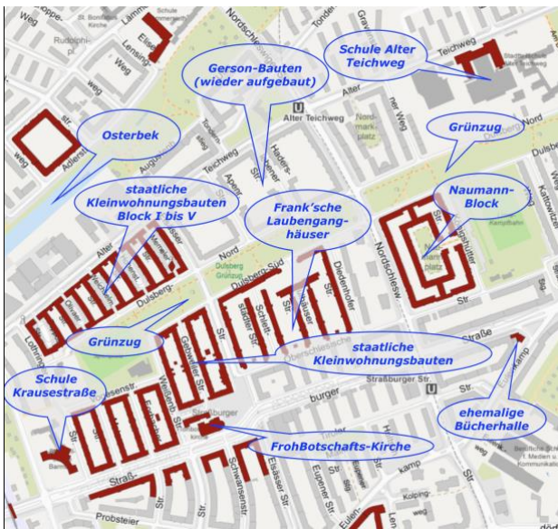
Ausschnitt aus der Denkmalkarte Hamburg ( dunkelrot : denkmal-geschützte Gebäude)

Beim Rundgang durch den weitgehend unter Denkmalschutz stehenden Stadtteil wird erläutert, welche Elemente der ursprünglichen Planung dieses durch Backstein, rhythmische Gliederungen der Baumassen und den die Mittelachse bildenden Grünzug geprägten Viertels die letzten 90 Jahre überdauert haben.